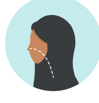
ضيق وصعوبة في التنفس