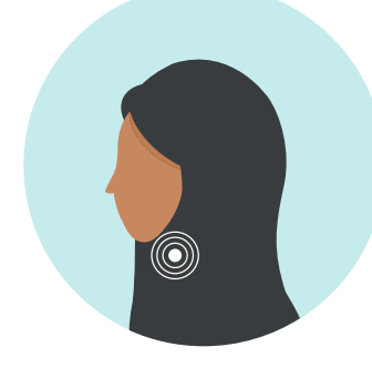
ألم في الحلق

إذا شعرت بأعراض كوفيد-19- يرجى القيام بمسح الأنف أو زياره أقرب مستشفى إذا كانت الأعراض شديدة